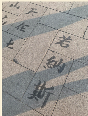
Le prénom de l'artiste écrit en chinois

Je suis de plus en plus convaincu que l'on peut effectivement distinguer une manière occidentale et orientale de décrire le monde dans nos manières de vivre intimement à l'intérieur.