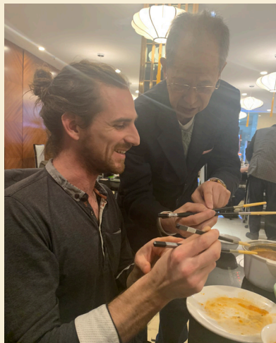
Apprentissage de l'utilisation des baguettes

Les baguettes chinoises sont, c'est certain, la caricature de la vision occidentale. Mais je découvre ce point où les éléments dénués de sens apparents, dénués par le geste, deviennent sensibles et sensés dans l'approche de la Culture.