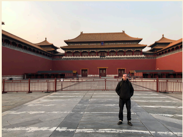
L'artiste sur la place de la Cité Interdite pendant la période de confinement

Les baguettes chinoises sont, c'est certain, la caricature de la vision occidentale. Mais je découvre ce point où les éléments dénués de sens apparents, dénués par le geste, deviennent sensibles et sensés dans l'approche de la Culture.