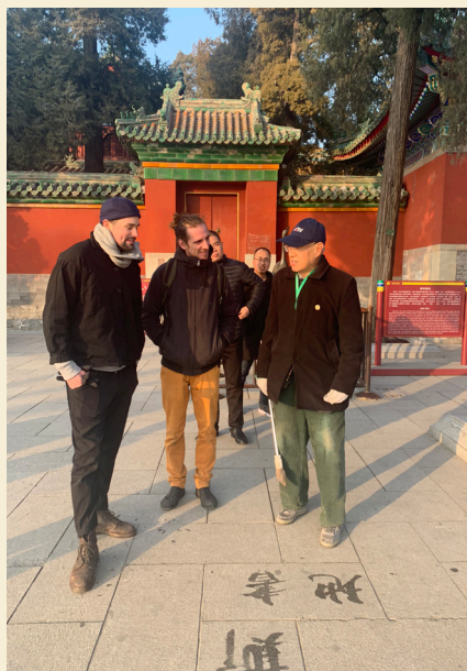
Rencontre au parc, un maître de la calligraphie